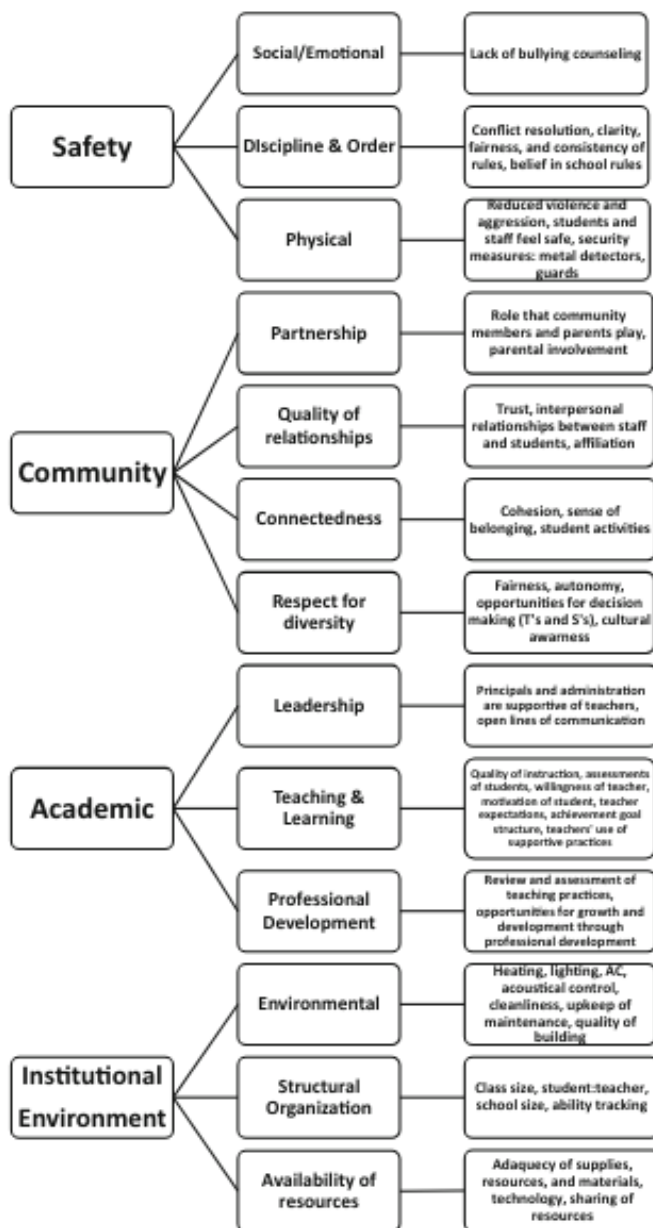
Fig. 1 The conceptualization and categorization of school climate